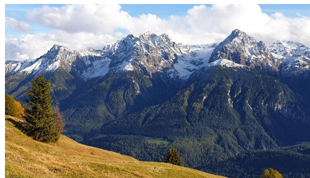
Bilddeskription: Mit Schnee verzuckertes Bergpanorama und goldener Wiese

Bei den Bergbanen Scuol geht es hoch hinauf zur Bergstation. Ab dort beginnt der Höhenweg Richtung Ftan, wo die atemberaubende Bergkulisse bestaunt werden kann. Danach besuchen wir das Thermalbad «Bogn Engiadina» in Scuol (Eintritt auf eigene Kosten).