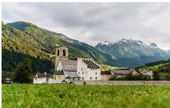
Bilddeskription: Kloster mit Bergkulisse im Hintergrund

Gemeinsam tauchen wir in die 1200-jährige Geschichte des als UNESCO Weltkulturerbe ausgezeichneten Klosters ein. Am Nachmittag begeben wir uns auf einen gemütlichen Spaziergang.