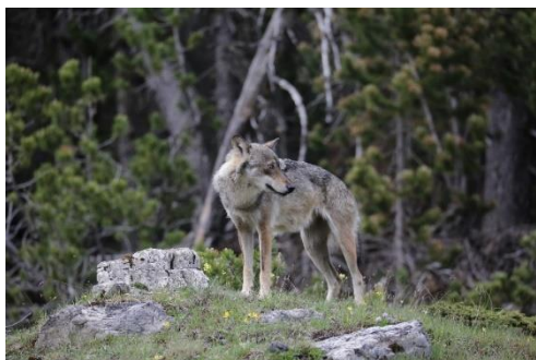
Bilddeskription: Wolf auf steinigem Hügel vor dem Wald.

Ein einheimischer Jäger und Wanderleiter führt uns durch die Biosfera Val Müstair. Die Teilnehmenden begeben sich auf die Spuren der Grossraubtiere. Das gemeinsame Wildessen rundet den Tag ab.