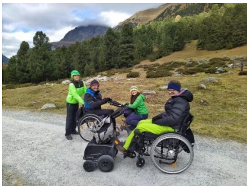
Bildbeschreibung: Gruppenfoto von Teilnehmenden im Rollstuhl.

Gemeinsam besuchen wir den God da Tamangur. Dies ist der höchstgelegene zusammenhängende Arvenwald in Europa. Da der Wald selbst nicht «barrierefrei» ist, bestaunen wir ihn von aussen.