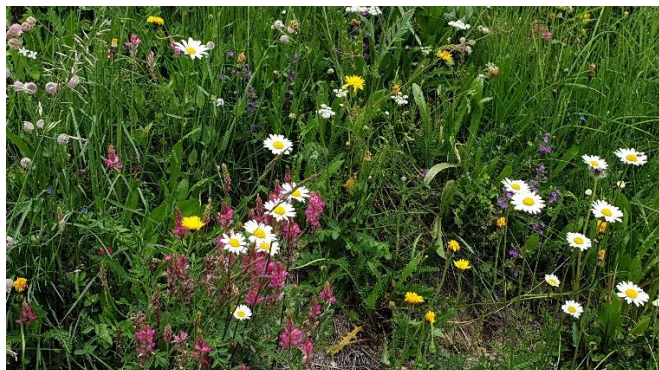
Bilddeskription: Wiese mit vielen Blumen

Im Juni spriesst im Engadin die Flora aus dem Boden. Dabei sind viele geschützte Blumen zu bestaunen, die es nur im Alpenraum zu beobachten gibt. Zudem besuchen wir das malerisch Vnà, welches viel Engadiner Kultur in sich trägt mit den typischen Engadiner Häuser.